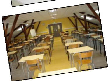
Salle de Devoirs