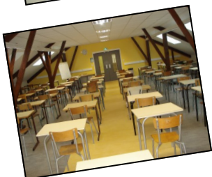
Salle de Devoirs